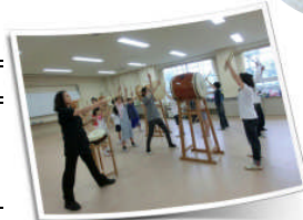
『西中田太鼓クラブ』

「西中田太鼓クラブ」は、2000年に西中田小学校の太鼓クラブのメンバーと「みちのくYOSAKOI祭り」に参加するために結成。本格的に活動を始めて来年で10年になります。現在は、小学生から大人まで約20人で、月に2回、日曜日の午後小学校の生活科室で太鼓を楽しんでいます。