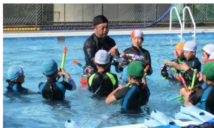
シュノーケリング体験会