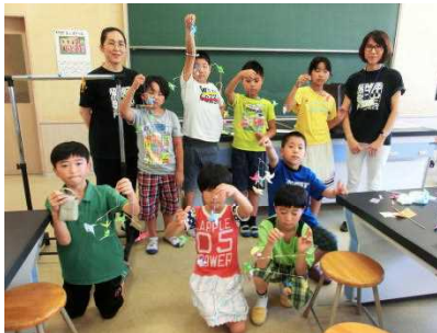
柳生和紙~ピル作り~