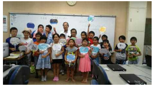
パソコン~うちわ作り~